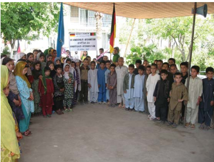
Die Kinder unseres Waisenhauses bei der Einweihung im Mai 2007