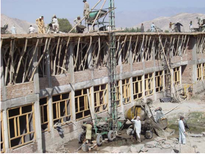
Die Marion-Dönhoff Schule, unsere bislang größte Schulbaustelle, gibt vielen afghanischen Vätern Arbeit