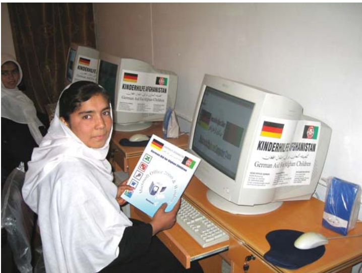
Eine glückliche Schülerin mit dem neuen PC-Lehrbuch in Paschtu