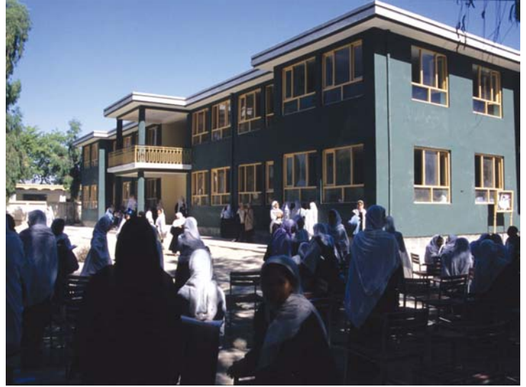
Bald sieht sie so schmuck aus wie die Bibi-Hawa-Mädchen-Oberschule