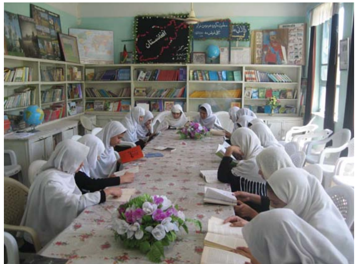
Jede Oberschule erhält eine gut ausgestattete Bibliothek